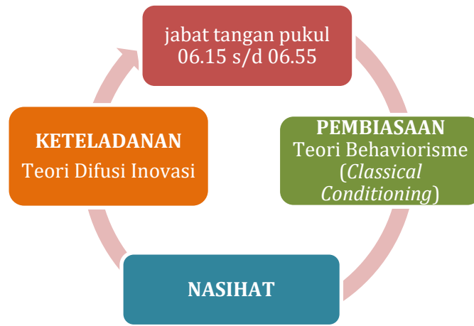
Gambar 1. Implementasi Pembiasaan Jabat Tangan Dalam Pembentukan Sikap Hormat Siswa